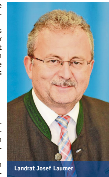
Landrat Josef Laumer

Mehr als 6000 Patienten vertrauen Jahr für Jahr donauMED. Effektivität und Qualität wurden jüngst auch von der kassenärztlichen Vereinigung bescheinigt. So ist donauMED eines von sieben anerkannten Arztnetzen bayernweit und absoluter Pionier auf dem Gebiet der ärztlichen Zusammenschlüsse. Das Erfolgsrezept aber bleiben meiner Überzeugung nach die