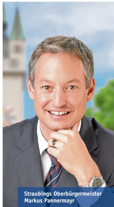
Straubings Oberbürgermeister Markus Pannermayr